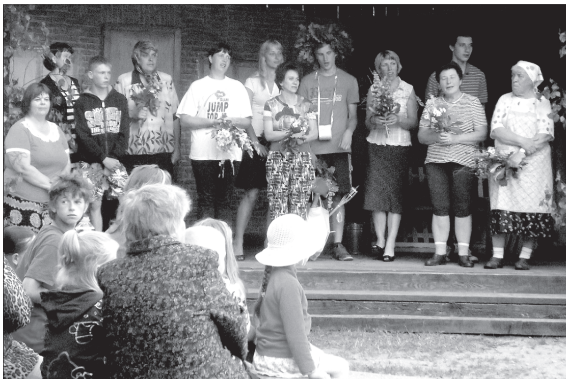
Amatierteātris "Vārava" Zirās.