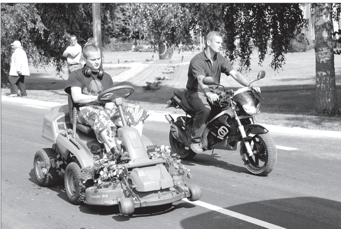
Vīri iemēģina, cik droša braukšana.