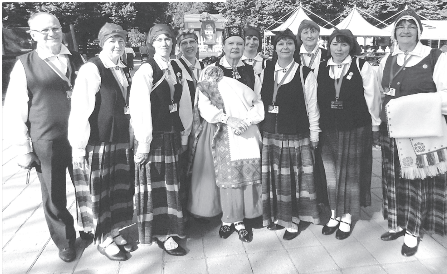
"Sītavas" dalībnieki kopā ar eksprezidenti Vairu Viķi-Freibergu.

Mēs dziedājām Esplanādē savas greznās dziesmas, arī stipro dziesmu, un kopā ar dziedātājiem no visiem Latvijas novadiem ieskandinājām Saules dziesmas. Tā kā bijām mazāk nodarbināti nekā koristi un dejotāji, varējām redzēt arī daļu no pūtēju orķestru koncerta Doma laukumā un kokļu koncertu Jēkaba katedrālē. Mums visiem bija liels pārsteigums par to, cik interesanti daudzo kokļu priekšnesumā izskanēja pat sarežģīti skaņdarbi, jo lielākoties jau esam pieraduši, ka kokli pas-trinkšķina tautasdziesmu pava-