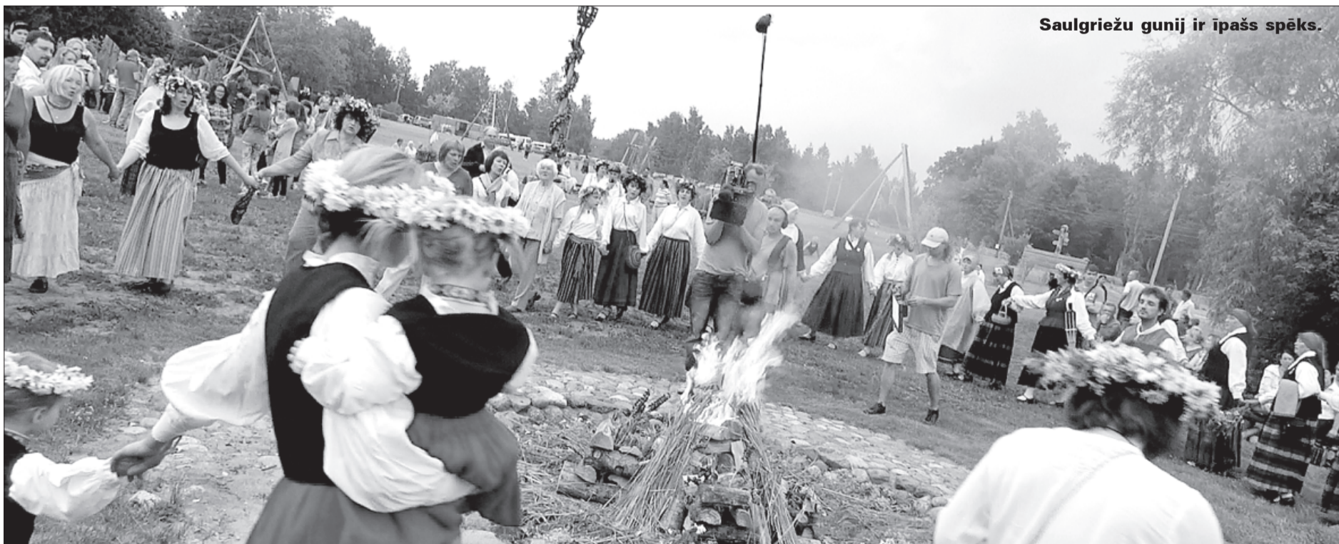
Saulgriežu gunij ir īpašs spēks.