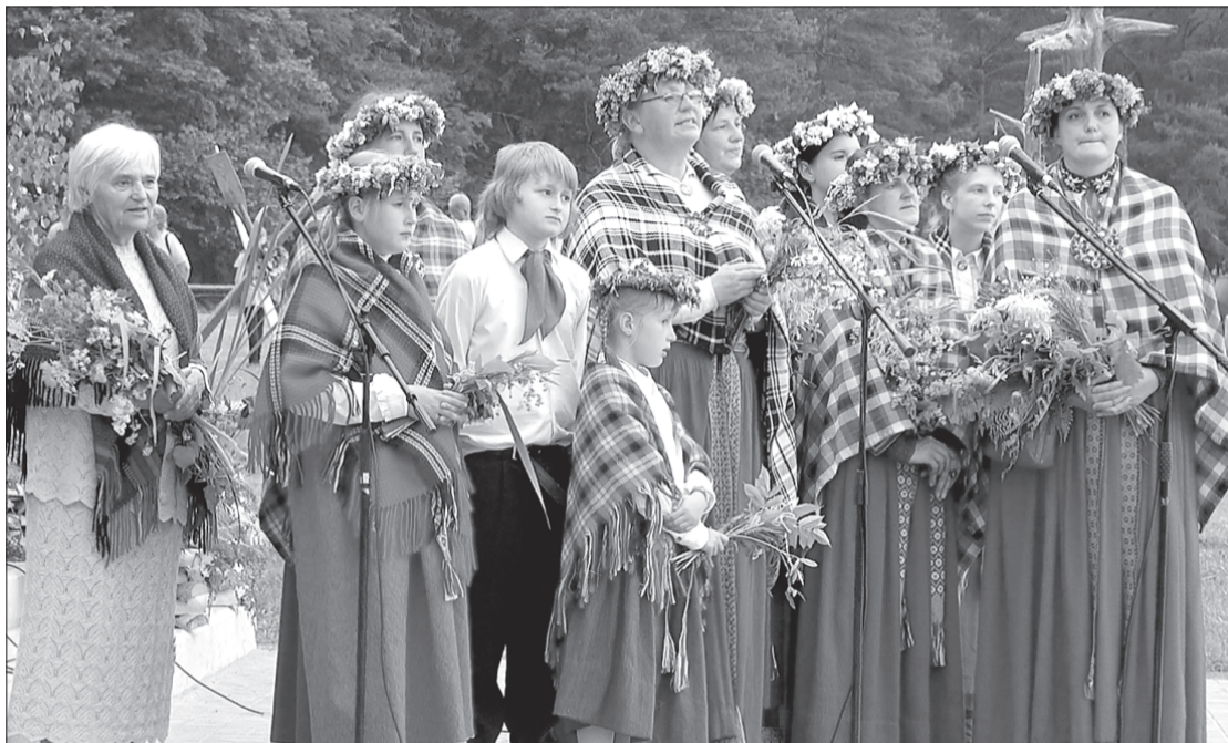
"Maģie suiti" iedrošina dziedāt visus Ugunsplāvā sanākušos.