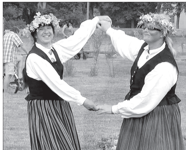
Jūrkalnē saulīti modināja arī ventspilnieces.