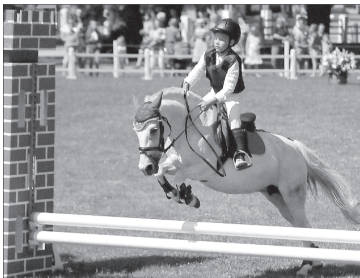
Skaists lēcians Renča dārzā notikušajās sacensībās.

startēja ar Lēdiju, izcīnot 6. vietu un konkursā "Gada labākais jātnieks 2013" kopvērtējumā ieņēmot 3. vietu. Gelintai ar Kamaro šajā maršrutā bija divas kļūdas.