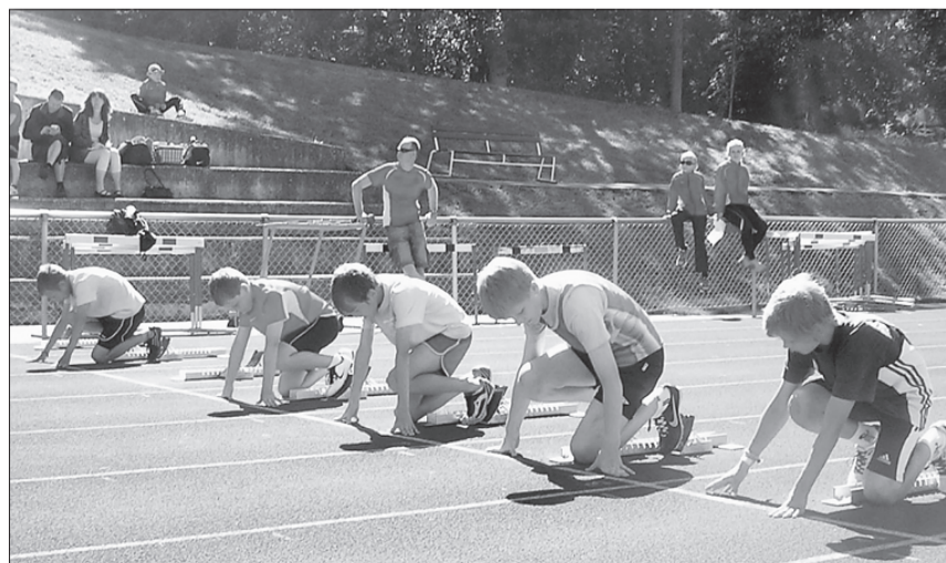
Vēl brīdis, un zēni skrīs ātrāk par vēju!