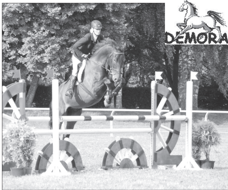
Gelintai padodas gan sportošana, gan pasākumu rīkošana. Šeit jātniece startē Kleistos.

Ātruma maršrutā ar šķēršļu augstumu 105 cm Gelintai ar Leksiju Lilū 8 soda punkti par diviem gāztiem šķēršļiem. Amatieru otrās grupas konkurencē maršrutā ar šķēršļu augstumu 115 cm Gelinta