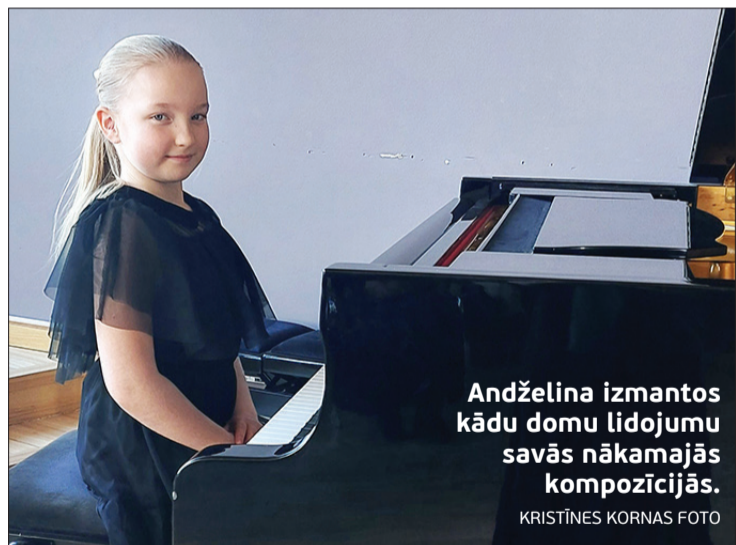
Andželina izmantos kādu domu lidojumu savās nākamajās kompozīcijās.