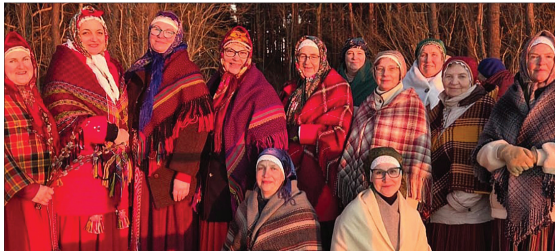
Etnogrāfiskā ansambļa “Maģie suiti” un folkloras kopas “Pūnika” dziedātājas Jūrkalnes stāvkraстā.

uz pagastu, no cilvēka pie cilvēka tika nests gaismas, dziesmas un pavasara prieka vēstījums.