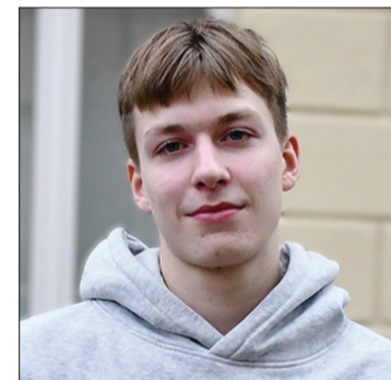
Nīla mērķis ir iekļūt Latvijas izlasē, un viņš uzskata, ka tas ir sasniezams.

"Mani uz priekšu dzen vēlme būt labākam par konkurentiem. Pirms sacensībām cenšos padzerties un dziļi elpot – tas palīdz