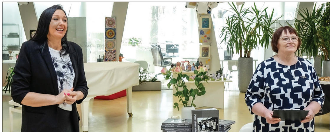
Grāmatas rediģētāja Sibilla (pa kreisi) un sastādītāja Skaidrīte atvēršanas svētkos Pārventas bibliotēkā.

cilvēkiem, kuri ar savu darbu un dzīvi atstājuši nospiedumus Puzes pagastā – tiem, kas būvējuši mājas, stādījuši kokus, kopuši laukus un sūri strādājuši, veidojot apkārtējo vidi. Laikam ejot, ne visās mājās ir palikuši iedzīvotāji – daudzas no tām šodien iezīmē vien ieauģuši pamati vai veci augļu koki, kas vēl klusībā stāsta par kādreizējo dzīvi.