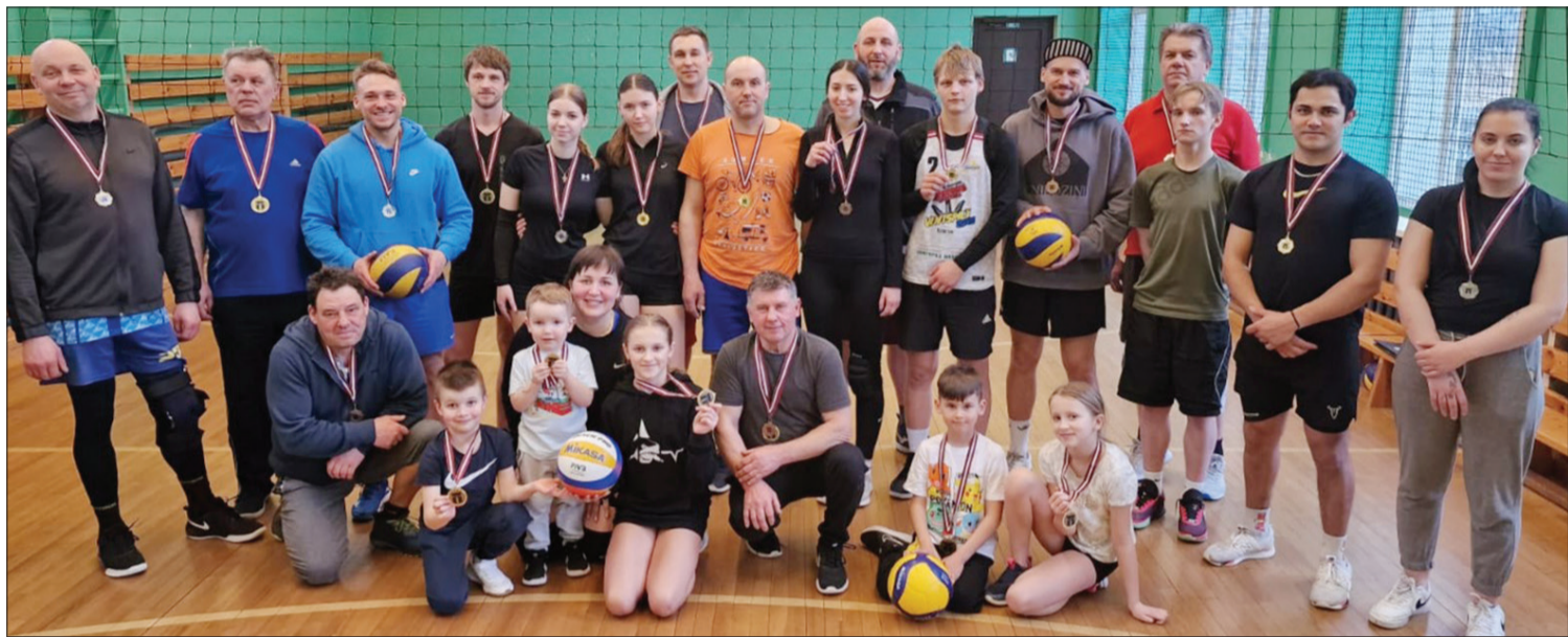
Normunda Bērenta piemiņai veltītā turnīra dalībnieki.

Pateicoties Užavas volejbolistiem, gaisma skolas sporta zālē vakaros ir redzama bieži. Šogad sportistu pulciņš ir paplašinā-