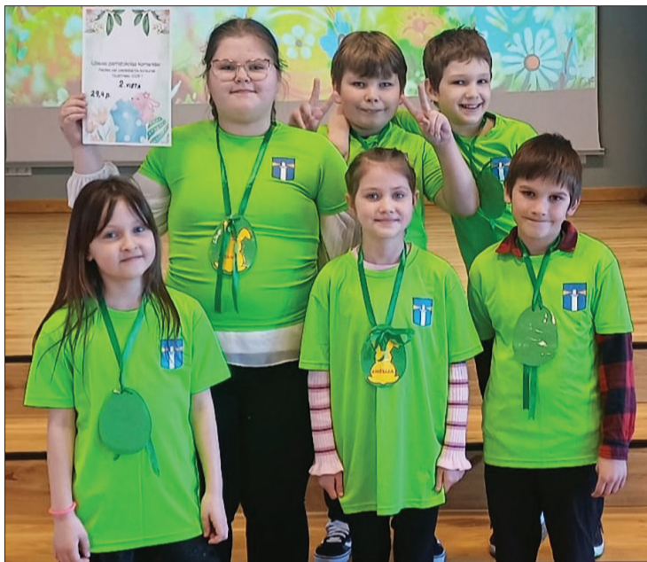
"Gudrinieka" komanda no konkursa atgriezās ar godpilno 2. vietu.