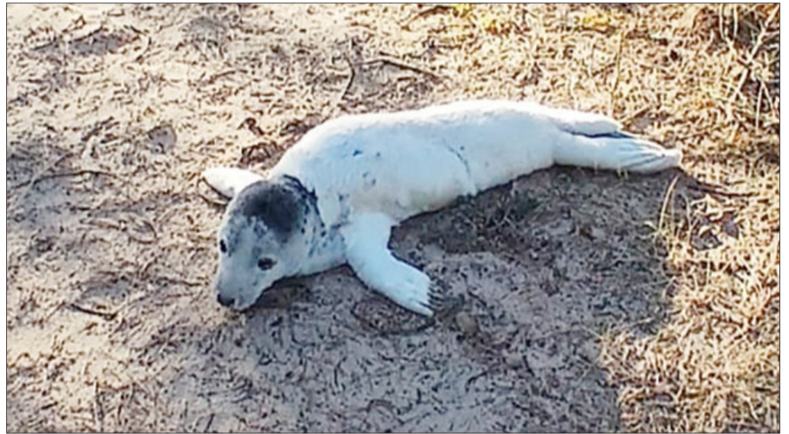
Šogad tas bija pirmais ronēns, kam Ventspils novada pašvaldības policijas darbinieki sniedza palīdzību, kā arī pirmais šāda veida gadījums ar roņu mazuli kopš iestādes pastāvēšanas.