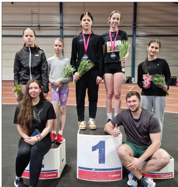
Sieviešu daudzciņas dalībnieces ar saviem treneriem.