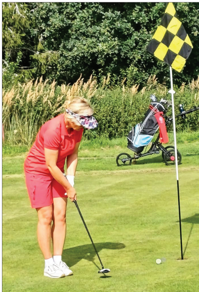
Golfu var spēlēt dažāda vecuma cilvēki – kā bērni, tā arī seniori.

Gribi būt aktīvs svaigā gaisā? Golfs Usmā aicina visu vecumu novada iedzīvotājus.