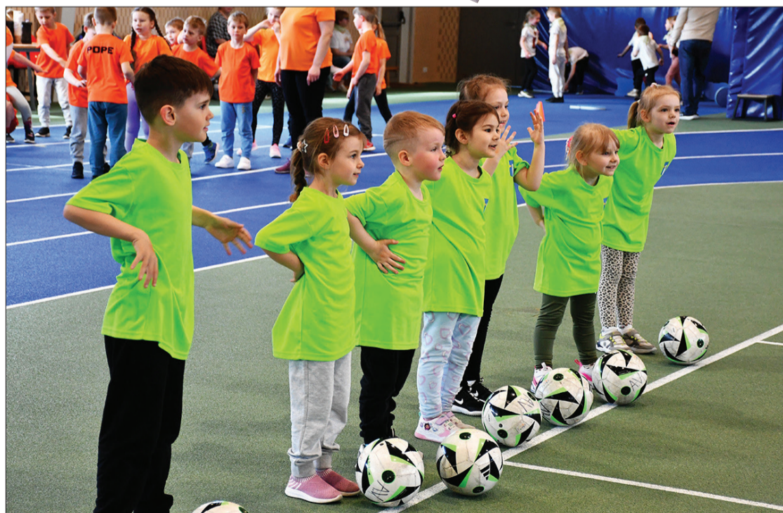
Bērni mācījās darboties komandā, pārbaudīja savu veiklību, precizitāti un ātrumu.