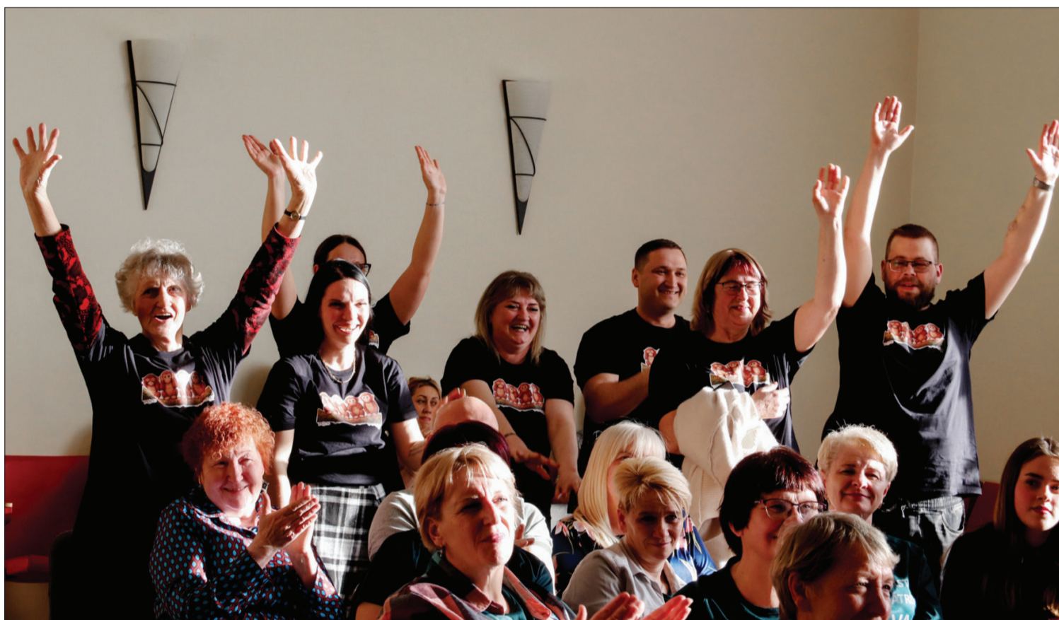
Patiesas emocijas un gaviles – Popes amatiereteātris "PATs" skatē ieguvis augstāko pakāpi.