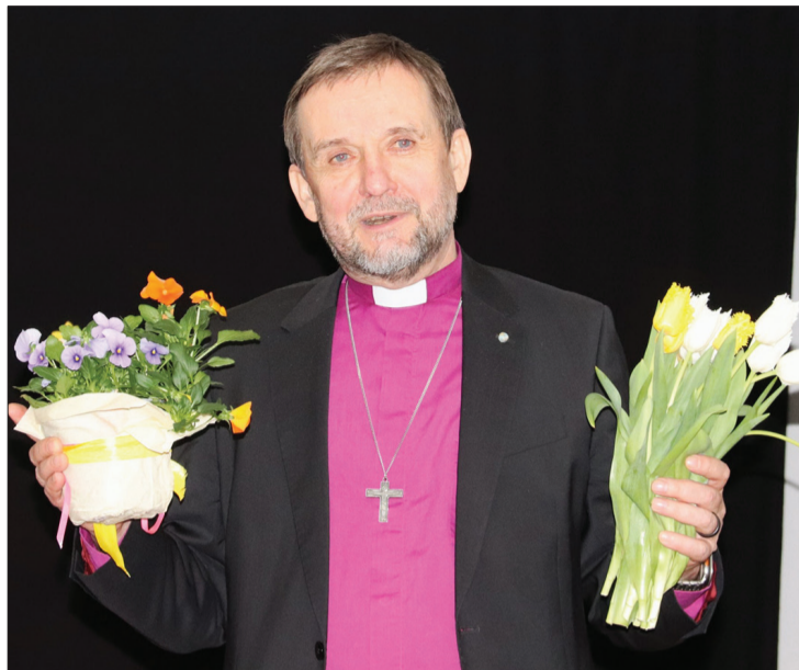
Bīskaps emeritus Jānis Vanags Puzē bija pateicīgs par uzmanīgu klausīšanos un sirsnīgo uzņemšanu.

Jānis Vanags savā 33 gadus ilgajā kalpošanā prata no postsovetiskas baznīcas ar smagu teoloģisko un padomju mantojumu to aizvest līdz mūsdienām: "Baznīca ir tas ķermenis, kurā Kristus dzīvo mūsdienu pasaulē. Viena lieta, ko Kristus darīja, bija liecināšana, un tā saistās arī ar arhibīskapa amatu. Tajā laikā, kad mani ievēlēja, baznīca bija stipri citāda. No vienas puses, tā bija ļoti ievainota un vārdzināta, bet, no otras puses, tika veikta dabīga izlase. Tie cilvēki, kuri turējās pie baznīcas, tie patiešām arī turējās un zināja, ko var zaudēt. Mani savā laikā par iešanu uz baznīcu atlauda no skolotāja darba. Atmodas laikā viss mainījās, baznīcai tas bija medus mēnesis. Baznīcas apmeklētāju skaits Saldū, kur es kalpoju, divu gadu laikā seškārojās. Tas bija tik vienkārši tajā laikā. Cilvēkos bija atvērtība un alkas pēc baznīcas un visa nepadomiskā. Baznīca jau tolaik bija vienīgā opozīcija. Kad omonieši ieņēma Preses namu, avīzes drukāja baznīcas tipogrāfijā. Kad vajadzēja reģistrēt dalībniekus Pilsoņu kongresā, to darīja baznīcās. Baznīca un atmoda bija