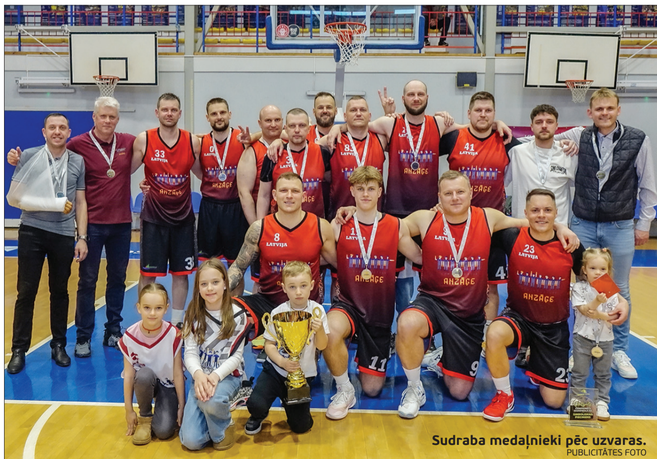
Sudraba medaļnieki pēc uzvaras. PUBLICITĀTES FOTO

1. maijā Olimpiskā centra “Ventspils” basketbola hallē norisinājās Ventspils pilsētas čempionāta basketbolā 2025./2026. gada sezonas finālspēles. Čempionātā piedalījās sešas komandas – “Man Cave Barbershop”, “Ventspils Tehnikums”, “Brīvostas pārvalde”, “Anzāģe/Pope”, “Niedras/Monumental” un “Ligo/Velo”.