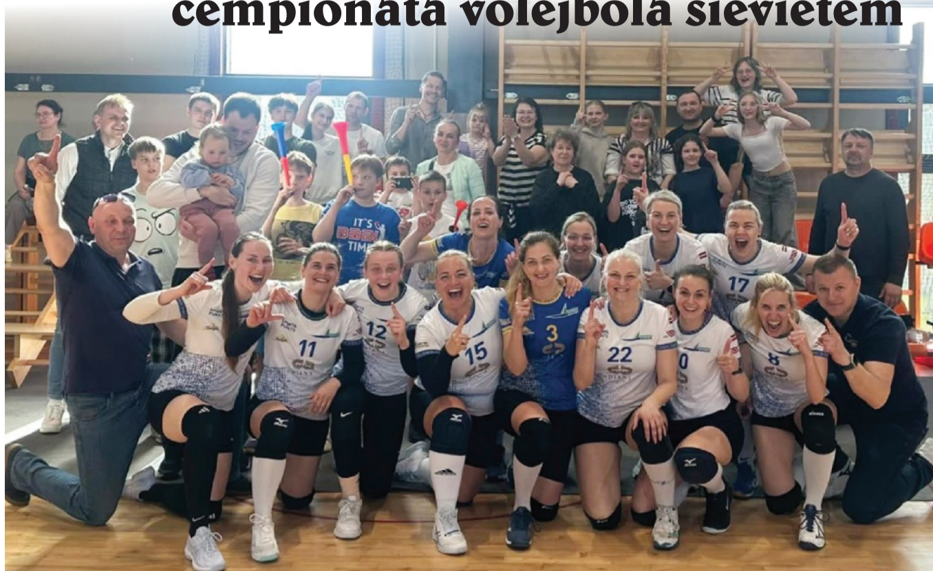
Ventspils novada sieviešu volejbolistes ar kuflu skaitu atbalstītāju.