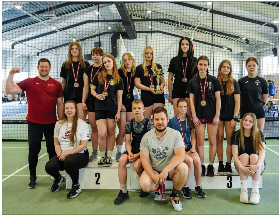
Latvijas čempionātā svāra stieņa spiešanā guļus piedalījās arī Ventspils novada sportisti.

Paldies "Latvijas Pauerlīftinga federācijai" par uzticēšanos otro gadu pēc kārtas rīkot Latvijas