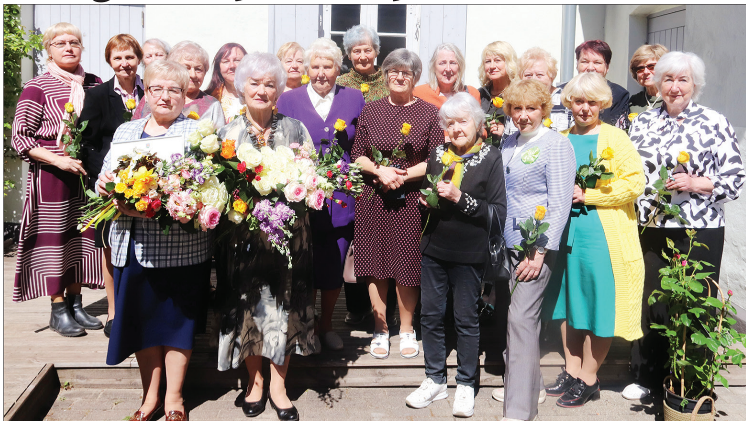
Apvienības "Spārni" dalībnieces svētku reizē Amatu mājas pagalmā.