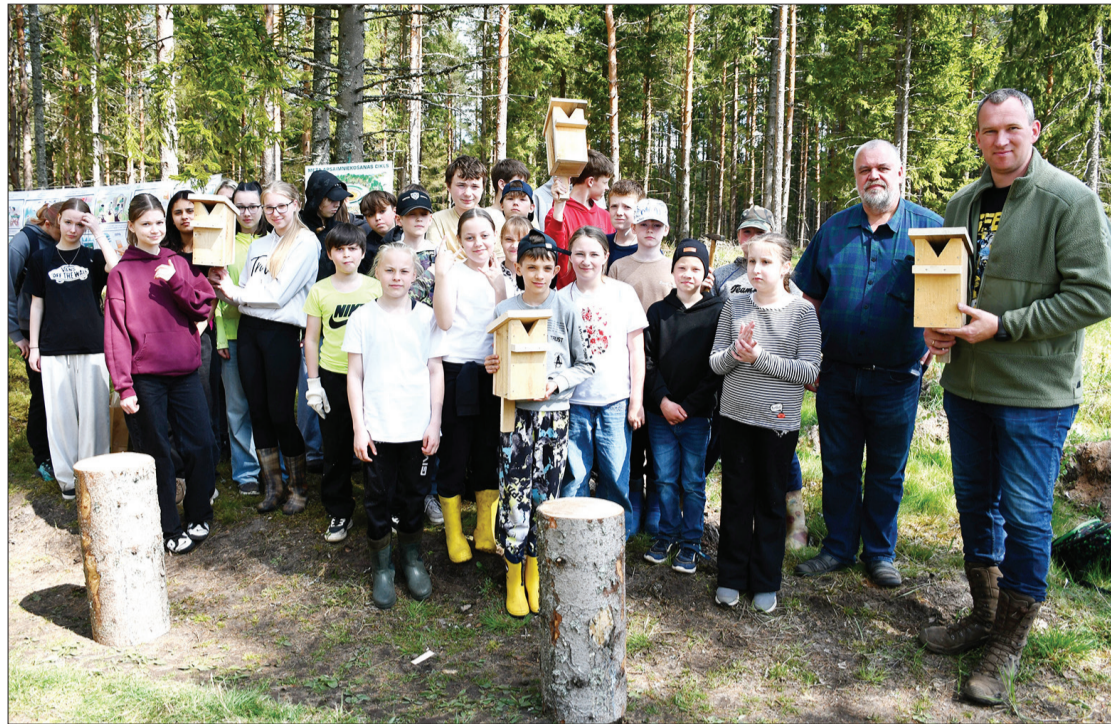
Skolēni kopā ar novada vadību rāda pašu izgatavotos putnu būrišus.

Pasākuma laikā jaunieši iepazīna arī konkrēto teritoriju. Vietas saimnieks Andris pastāstīja, ka teritorija atrodas vēsturiskajās Mētru un Zūru mežniecībās, kuru nosaukumi joprojām tiek saglabāti. Apkārt 33 ha lielajai platībai izbūvēts aptuveni 2,5 km garš žogs, kura ierīkošanai bija nepieciešami gandrīz 800 stabi. Iepriekš šī teritorija tika apmežota jau 2019. gadā, taču staltbrieži jaunaudzi nopostīja, tādēļ mežs jāstāda no jauna.