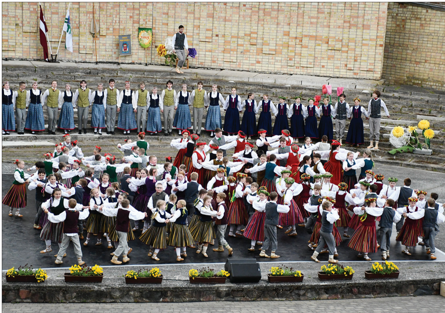
Novada skolu deju kolektīvi kopīgā dejā Popes estrādē.

27. maijā Popes estrādē norisinājās Ventspils novada skolu deju kolektīvu koncerts, kas ik gadu pulcē novada dejojājus kopīgā mācību gada noslēguma atskaites koncertā. Kā ierasts, pasākumu ievadīja svinīgs gājiens no Popes muižas līdz estrādei, kurā dejojāji ar kolektīvu karogiem, smaidiem un sveicieniem priecēja vecākus, draugus un skatītājus.