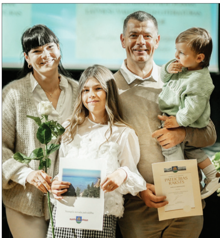
Vairāki izcilnieki svētkos bija kopā ne tikai ar vecākiem, bet arī jaunākajiem brāļiem un māsām.