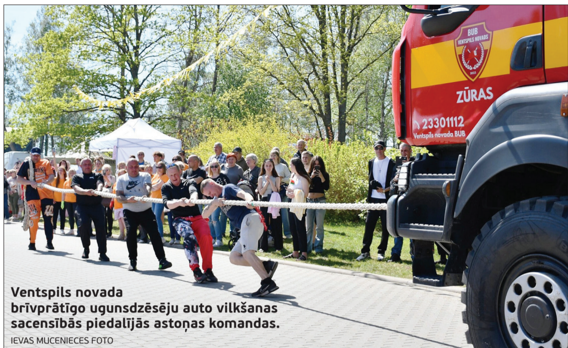
Ventspils novada brīvprātīgo ugunsdzēsēju auto vilkšanas sacensībās piedalījās astoņas komandas.

Dienas gaitā notika plaša kultūras programma. Pasākumu atklāja Ventspils novada pašvaldības kolektīvu koncerts, kurā piedalījās Ances senioru deju kolektīvs, Vārves deju kolektīvs "Vārve", Ugāles