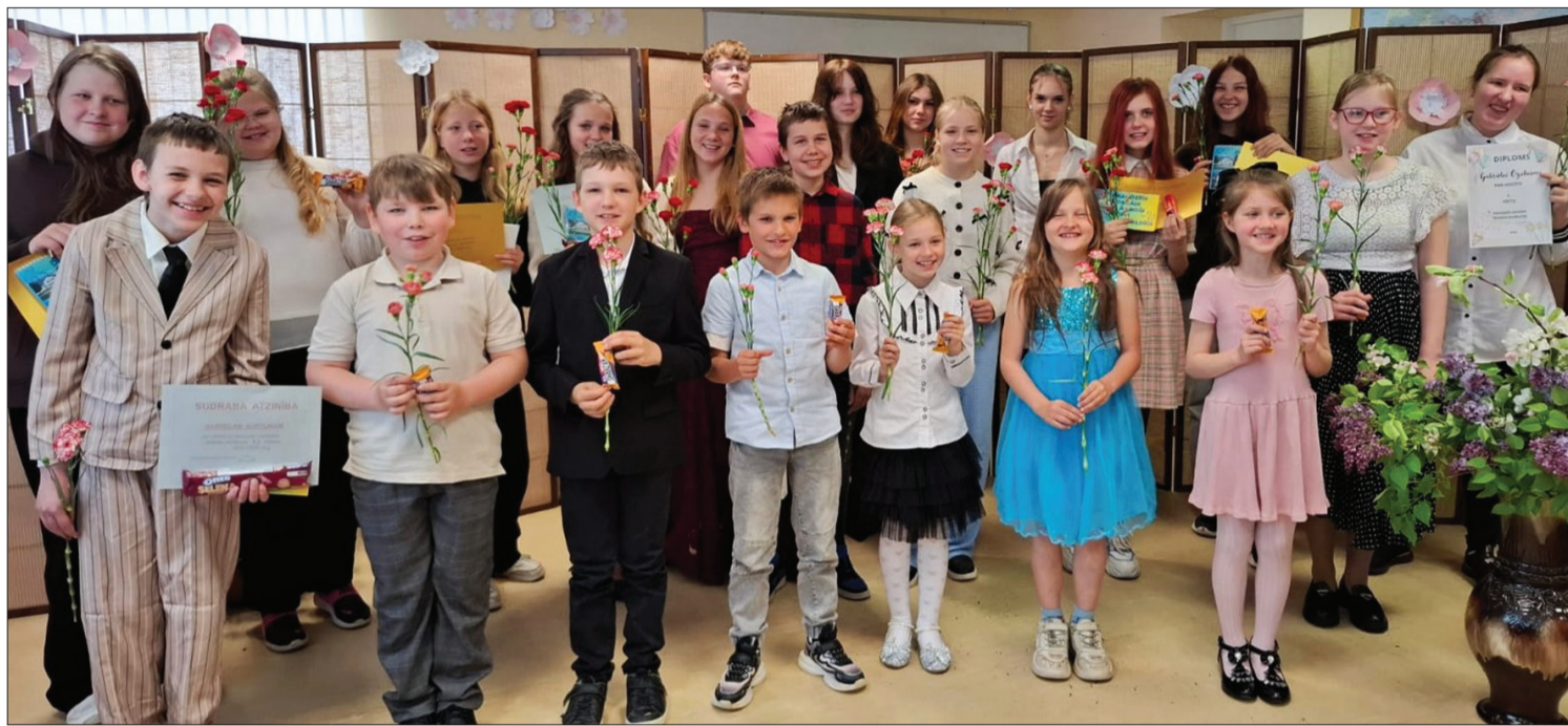
Ābeļziedu pasākumā izskanēja daudzi paldies.

lēni devās aizraujošā ekskursijā uz minizoo “Zemturi”, kur pavadīja sirsnīgu un emocionālu bagātu dienu. Bērni ar lielu prieku iepazīnās ar dažādiem dzīvnieciņiem, vēroja tos, samīloja un uzzināja daudz interesanta par to ikdienu.